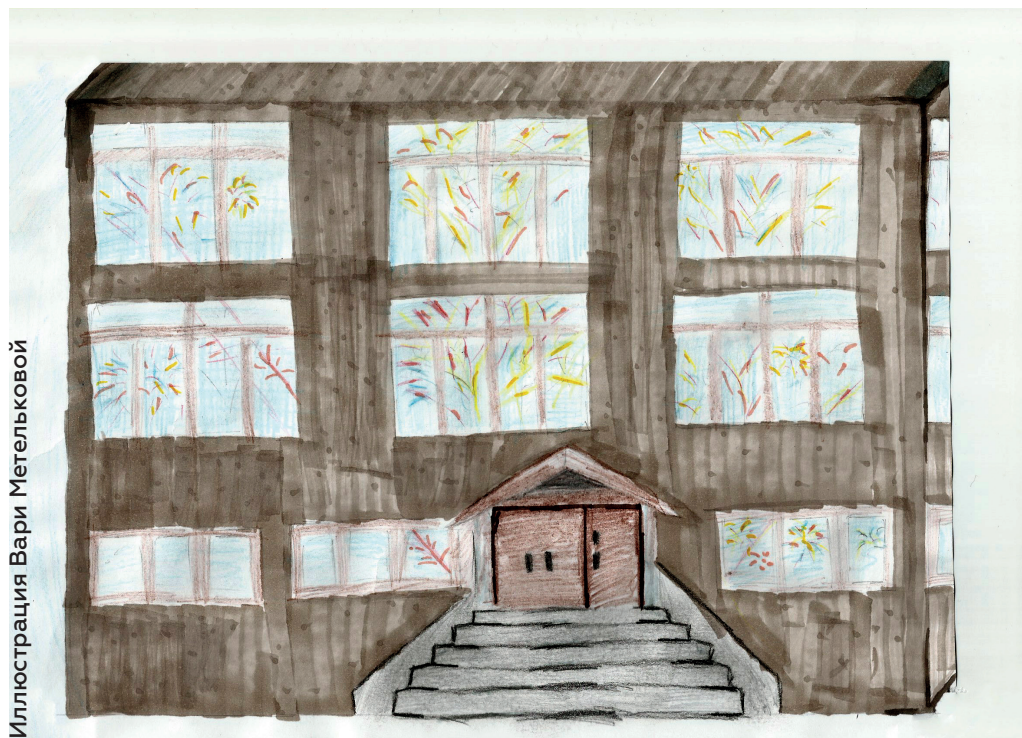
Иллюстрация Вари Метельковой