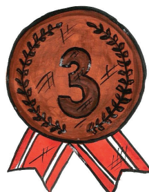
Иллюстрация Виктории Ширма