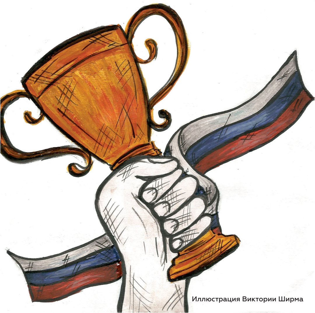
Иллюстрация Виктории Ширма