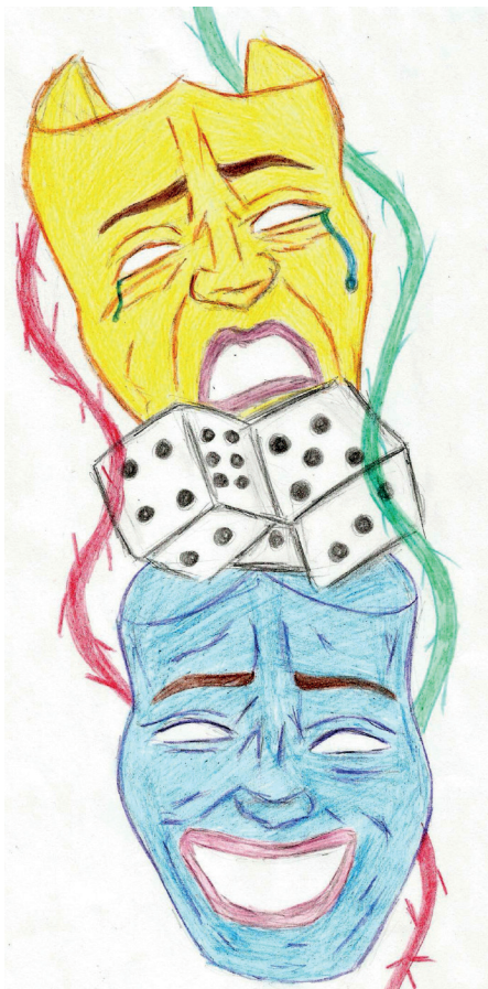
Иллюстрация Анны Куделиной

— Самое главное то, что участники получили заряд положительных