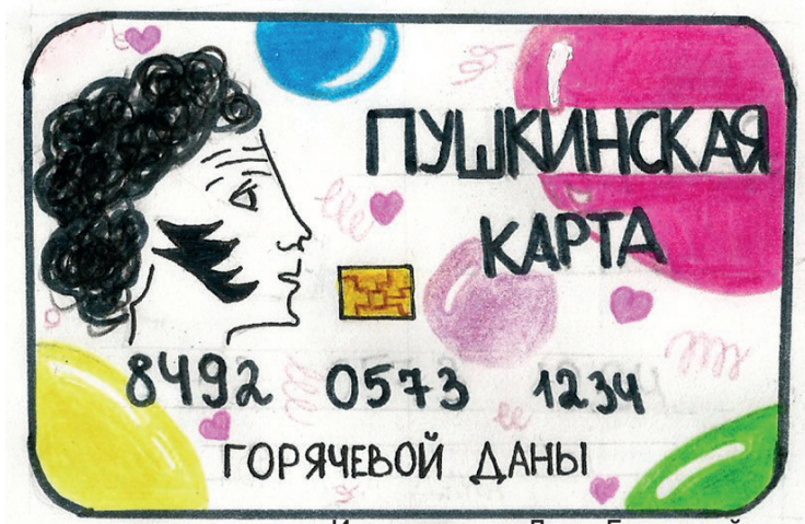
Иллюстрация Даны Горячевой