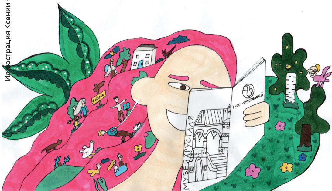
Иллюстрация Ксении Сайковой